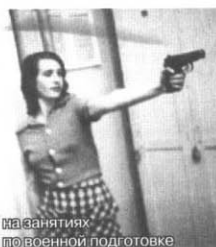
на занятиях по военной подготовке

А однажды наша француженка после очередного посещения Москвы, куда она ездила в посольство за книгами и фильмами, а также для пополнения продуктовых запасов, явилась в университет в фуфайке. Оказалось, что в один из столичных универсамов завезли партию