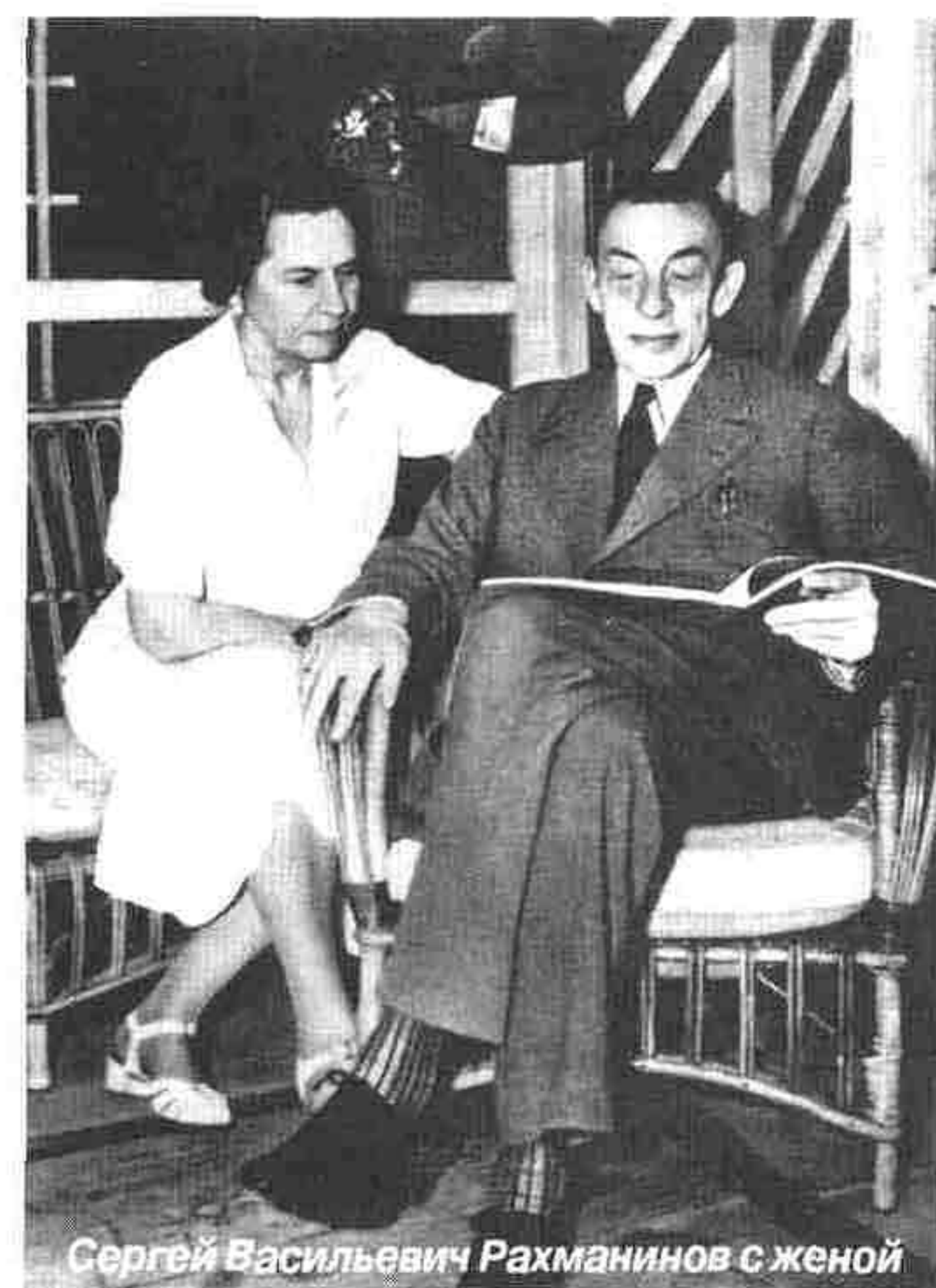
Сергей Васильевич Рахманинов с женой