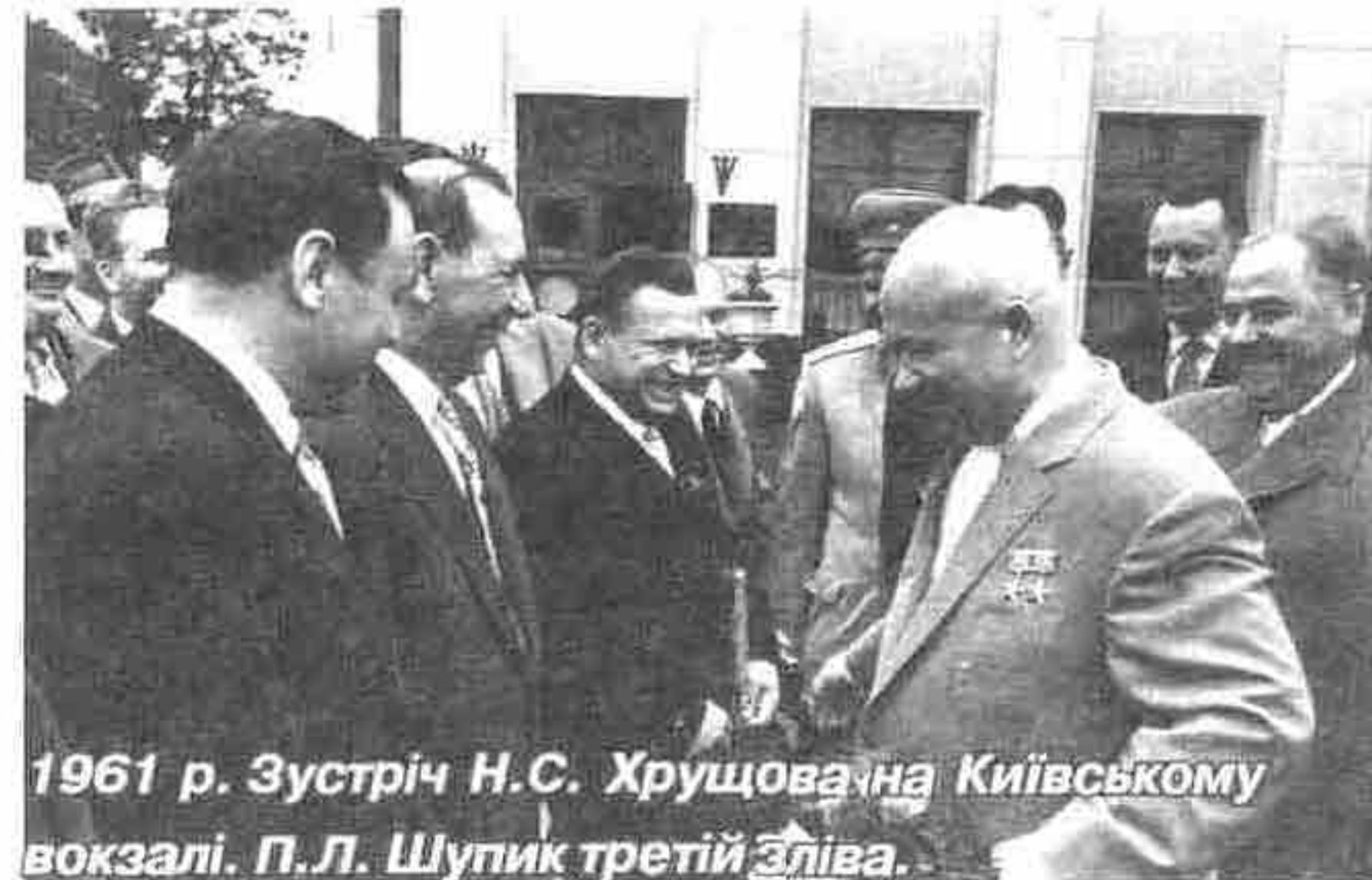
1961 р. Зустріч Н.С. Хрущова на Київському вокзалі. П.Л. Шупик третій зліва.

Наприкінці 50-х – початку 60-х років у зв'язку з поширенням спеціалізованих видів медичної допомоги населенню країни постало питання про необхідність розвитку пріоритетних напрямків медичної науки та організації у зв'язку з цим науково-дослідних інститутів. Під безпосереднім керівництвом П.Л. Шупика була розроблена відповідна програма і протягом декількох років створено інститути (подаються за сучасними назвами): урології АМН України, отоларингології ім. О.С. Коломийченка АМН України, ендокринології та обміну речовин ім. В.П. Комиссаренка АМН України, геронтології АМН України в Києві; загальної та невідкладної хірургії АМН України в Харкові; НДІ травматології та ортопедії Донецького медичного університету ім. О.М. Горького; Українського НДІ промислової медицини АМН України у Кривому Розі. Крім того, здійснена реорганізація Київського рентгенінституту в інститут онкології й радіології. Створені інститути нині відомі не тільки в Україні, а й за її межами, їхній