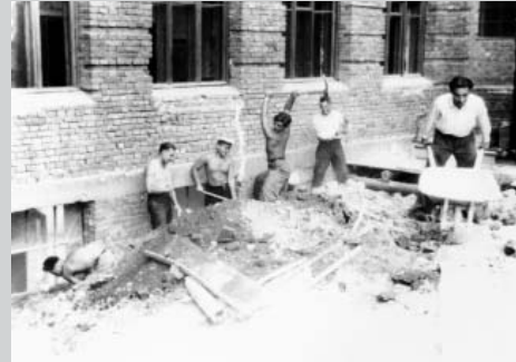
Студенти на роботах по відновленню морфокорпуса ХМІ (пр. Науки, 4). На передньому плані майбутній к.м.н., завідувач кафедри радіології І.Ф. Бодня (1950-е)

Продолжаем знакомство с экспозицией музея истории. Представляем вниманию читателя отдельные фотографии, посвященные работе Харьковского медицинского института в послевоенное время.